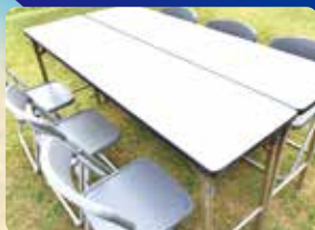
※6名用テーブル席 イメージ写真